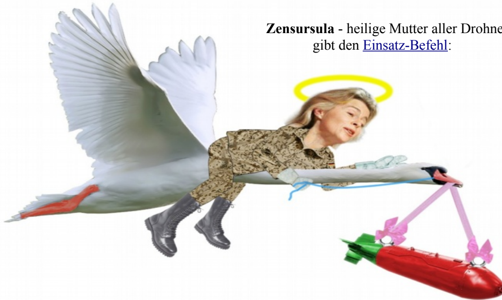
Zensursula - heilige Mutter aller Drohnen gibt den Einsatz-Befehl :

Wo man anfängt, den Krieger von dem Bürger zu trennen, ist die Sache der Freiheit und Gerechtigkeit schon halb verloren. (Johann Gottfried Seume)